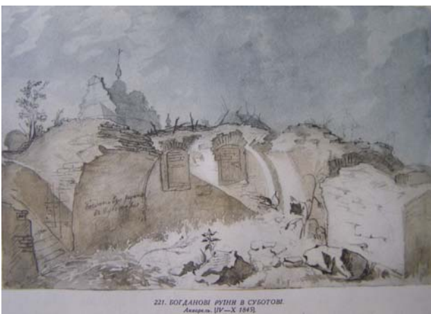
221. БОГДАНОВІ РУЇНИ В СУБОТІВІ. Листопад. 19—X 1845.

России ...” Д. Бантиш-Каменського [2]. На задньому плані цього зображення видніються рештки західної стіни будівлі. Руїни збереглися на рівні першого поверху й, враховуючи відстань та перспективу, не поступалися Ільїнській церкві.